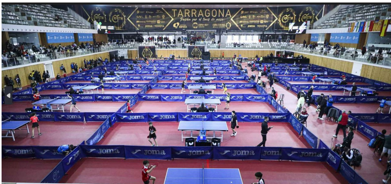
Palau d'Esports Catalunya a Tarragona, seu Campionats d'Espanya